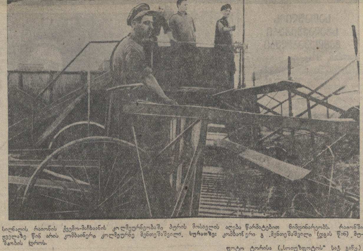
სიღალის რაიონის მშენებელთა კოლმეურნეობაში პირის მოსახლეობის აგება წარმართული მიმდინარეობს. რაიონში მშენებლის წინ არის კომპლექსური მშენებლობა.

პარტიული თემაზე მედიკალიზაცია პარტიული თემაზე მედიკალიზაცია პარტიული თემაზე მედიკალიზაცია