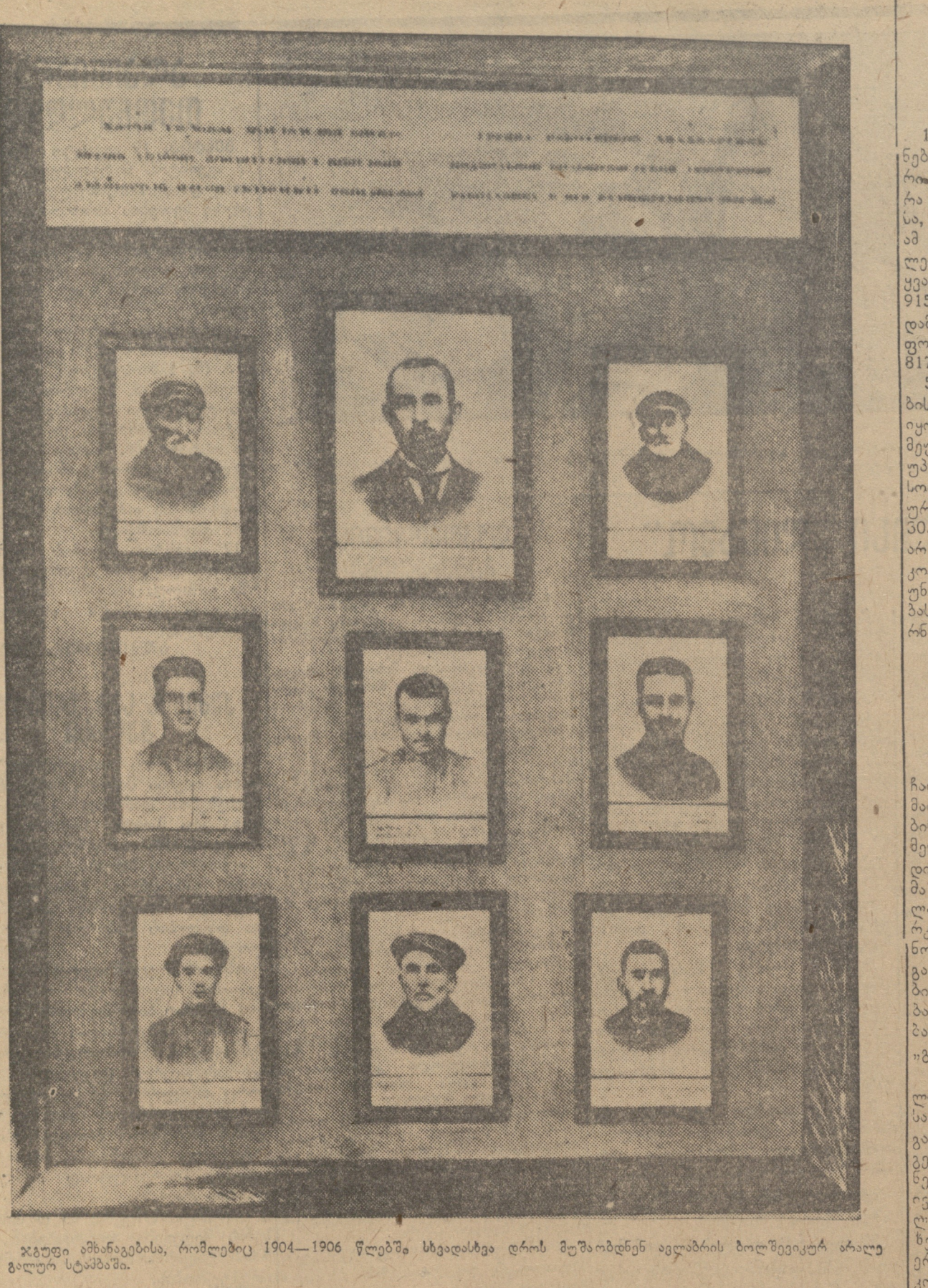
ჯგუფი ამხანაგების, რომლებიც 1904-1906 წლებში სხვადასხვა დროს მუშაობდნენ ავღაბრის ბოლშევიკურ არალეგალურ სტამბაში.