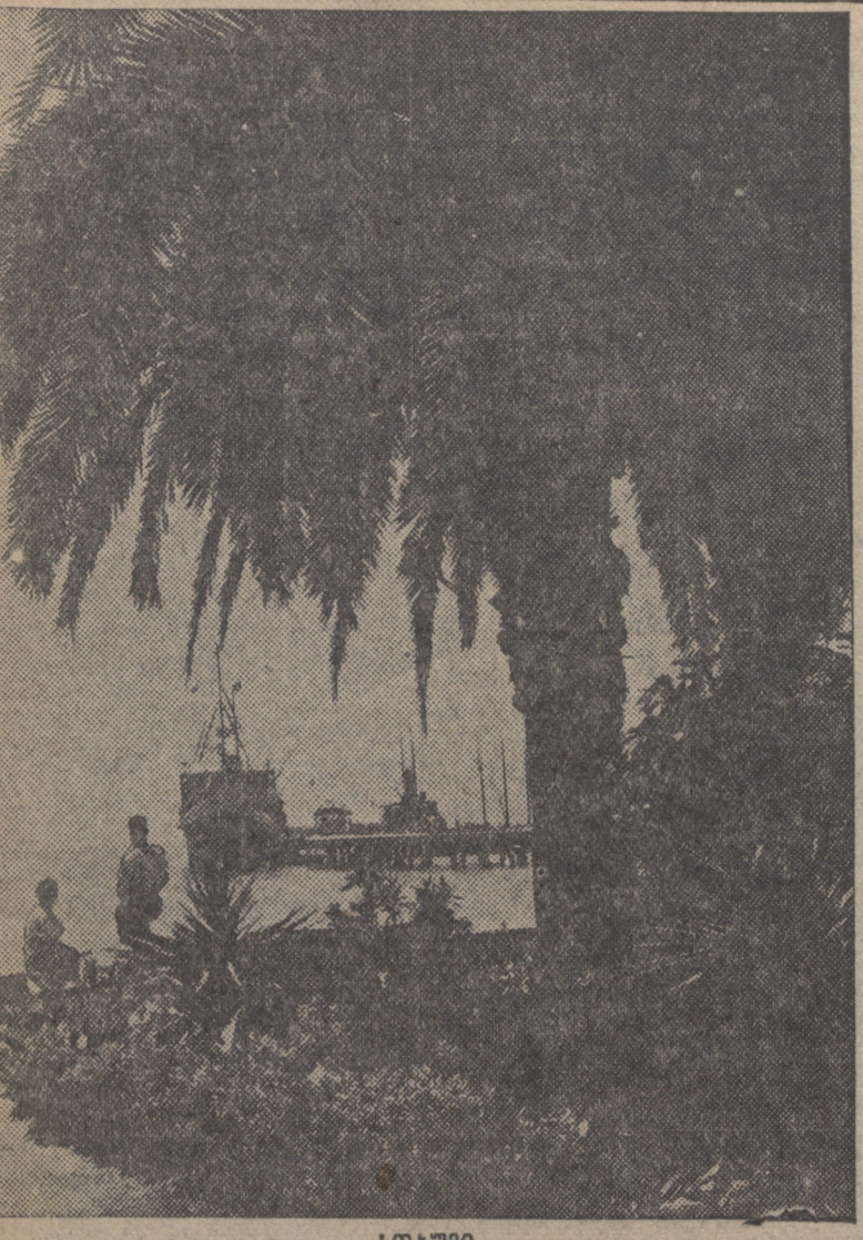
სოხუმი. სურათი: თბილისის "არმენია" სოხუმის ნავსადგურში (ხედი ქალაქის სანაპირო ბაღიდან).