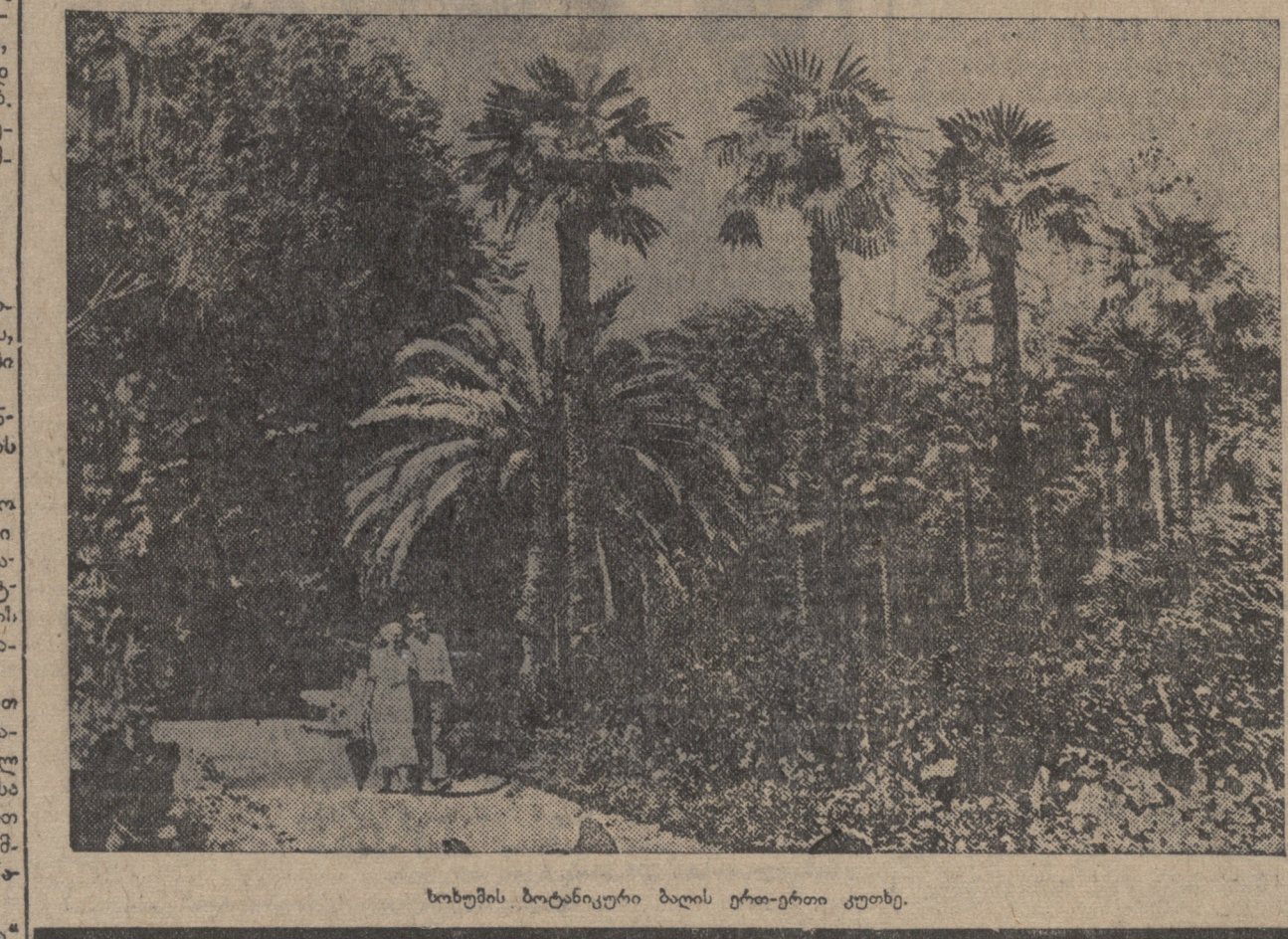
სოხუმის ბოტანიკური ბაღის ერთ-ერთი კუთხე.

ოქტომბრის დიდი რევოლუციის დროს... გამოგონებები ნოვითი დიდი... სოხუმის ბოტანიკური ბაღის ერთ-ერთი კუთხე.