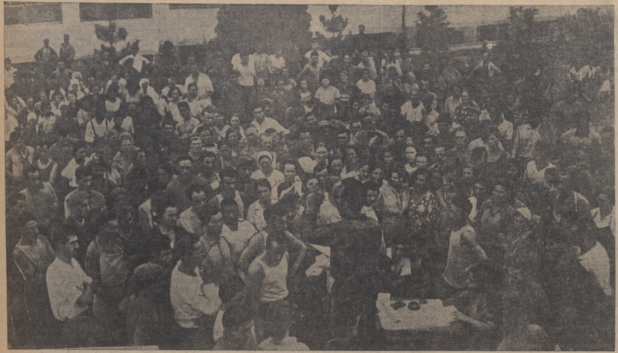
საბჭოთა კავშირის მშენებელი, 3 სექტემბერი (საქმე- სის) მთავრობის განცხადებით...