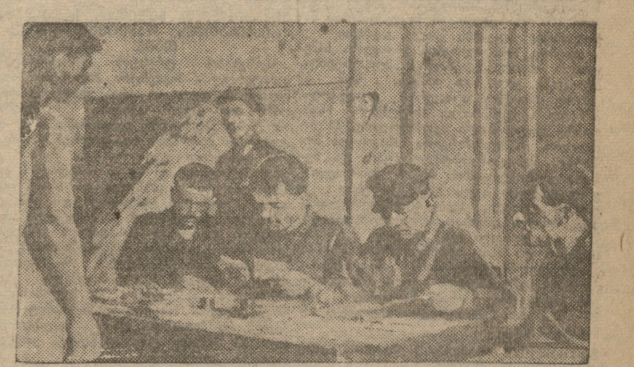
ჯიჯი გაწვევის კომისია მიხედვით