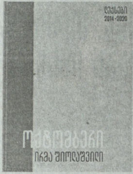
ირმა შიოლაშვილის ლექსებს როცა ვკითხულობ, არასოდეს მტოვებს შეკითხვა: