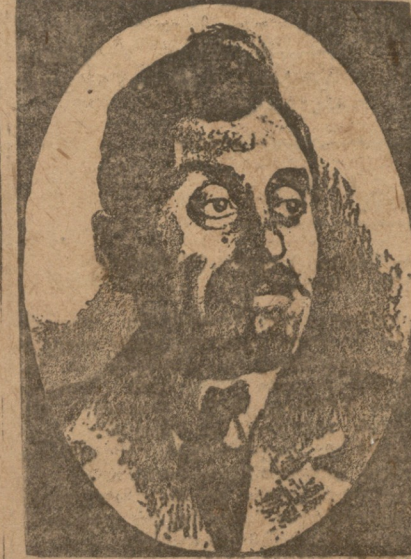
სათესი აკადრირებული ყოფს...