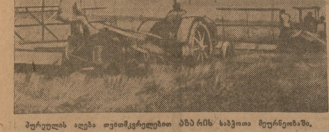
სანიშნო რაიონების მნიშვნელობა