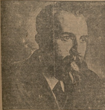
მაგ. ვაჩე ვაჩე