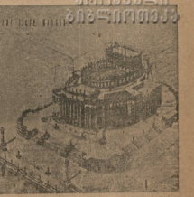
ქვემოთ ხეივანი მუხრანის მუხრანის მუხრანი