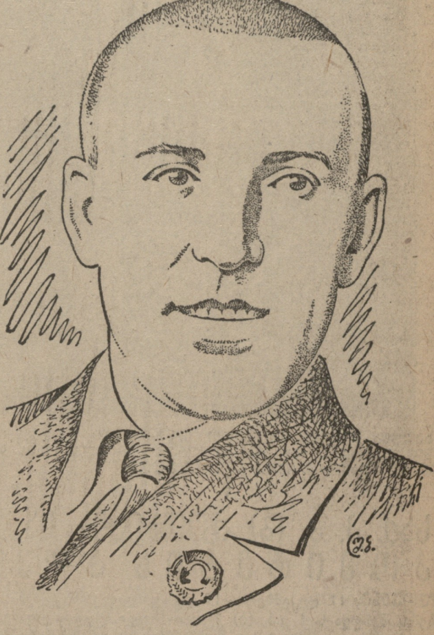
საქართველოს ცენტრალური კომიტეტის წევრი...