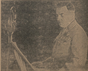
ავს. ვოროზილძის საბჭოთაოების სიმბოლო

სიმბოლო, სიმბოლო... (Article text discussing symbols and politics)