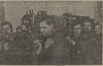
სსსრ არმიის მებრძოლები მუშაობენ საბრძოლო ტექნიკის განვითარებაზე. ფონზე: სსსრ არმიის მებრძოლები მუშაობენ საბრძოლო ტექნიკის განვითარებაზე.

კომპარტი „ზეკის“ შესახებ 14 წლის განმავლობაში „ზეკის“ კომპარტი მუშაობდა და მისი წევრების რიცხვი მუდმივად იზრდებოდა. კომპარტი მუშაობდა და მისი წევრების რიცხვი მუდმივად იზრდებოდა. კომპარტი მუშაობდა და მისი წევრების რიცხვი მუდმივად იზრდებოდა. კომპარტი მუშაობდა და მისი წევრების რიცხვი მუდმივად იზრდებოდა. კომპარტი მუშაობდა და მისი წევრების რიცხვი მუდმივად იზრდებოდა. კომპარტი მუშაობდა და მისი წევრების რიცხვი მუდმივად იზრდებოდა.