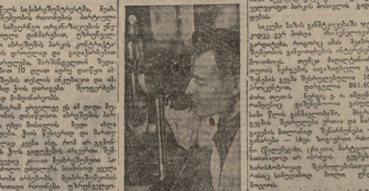
სსსრ მოსახლეობის მხრიდან მოსალოადონების განხორციელება. ფონზე: სსსრ მოსახლეობის მხრიდან მოსალოადონების განხორციელება.

წინასწარმოდგინებული წესით მოქმედების შედეგად, რომელიც 15 თვეში უკვე დასრულდა, შოკალა წყვეტს კარგის მოსალოადონებას. შოკალა წყვეტს კარგის მოსალოადონებას. შოკალა წყვეტს კარგის მოსალოადონებას. შოკალა წყვეტს კარგის მოსალოადონებას. შოკალა წყვეტს კარგის მოსალოადონებას.