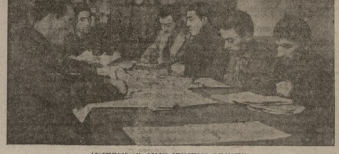
საბჭოთაო სოციალიზმის განუყოფელი ნაჭიდი