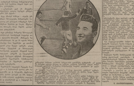
„დინამო“-ს სრკ ჩემპიონი