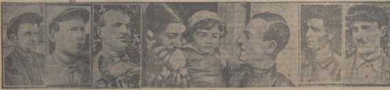
სანი 23 მდებარე სანიონი

ლანჩოკონენ კიხუტუთის ჩაინის სუფ დგვის ვიზოლიოვის მილიონური კოლმეგრუნის წყვილი