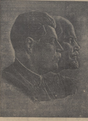
ՅՄԱԿԱՅԻ ՄԱՅՄԱՆԻՆԻ ԿՅՈՒՐԱՅԻՆ ԲՈՒՆՈՒՄԻ

ՅՄԱԿԱՅԻ ԿՅՈՒՐԱՅԻՆ ԲՈՒՆՈՒՄԻ ՄԱՅՄԱՆԻՆԻ ԿՅՈՒՐԱՅԻՆ ԲՈՒՆՈՒՄԻ