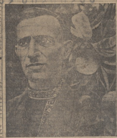
ჩვენი სხვაობის მნიშვნელობა