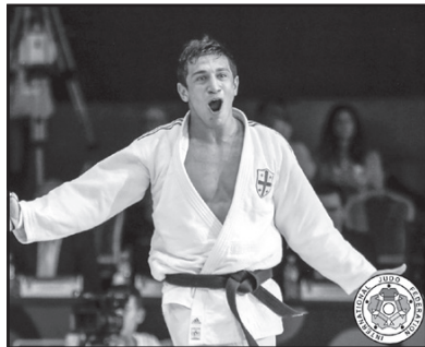
32-ე ოლიმპიური თამაშები იაპონიის დედაქალაქ ტოკიოში 23 ივლისიდან 8 აგვისტომდე გაიმართება.

სამწუხაროდ, მსოფლიოს ჩემპიონატზე გუნდურ ასპარეზობაში დაშვდა და მხარი დაიხიანა. მისი ასპარეზობა დამოკიდებულია მის სრულად გამოჯანმრთელებაზე. ის და ნიკოლოზ შერაზადიშვილი ნახევარფინალში ერთმანეთს ხშირად უპირისპირდებიან, მაგრამ, უპირველეს ყოვლისა, მას ძლიერ მეტოქეებთან ბრძოლა მოუწევს. შეგახსენებთ, რომ ზაფხულის