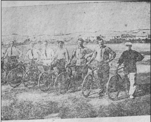
სახელობის ჩაის საბჭოთა მეურნეობის კვლევისათვის მოცემული მუშები იმავან დროს იმდენი ხელმძღვანელობით