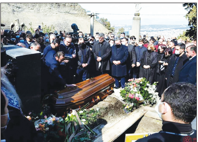
2 აპრილს, მუსიკოსი, ფოლკლორის სახელმწიფო ცენტრის სამეურვეო საბჭოს

თავმჯდომარე, ანსამბლ „რუსთავის“ ხელმძღვანელი, საქართველოს ხელოვნების დამსახურებული მოღვაწე ანზორ ერქომაიშვილი მთაწმინდის მწვერალთა და საზოგადო მოღვაწეთა პანთეონში, ისტორიკოს სიმონ ჯანაშიასა და ნიკო ბერძენიშვილს შორის დაკრძალეს.