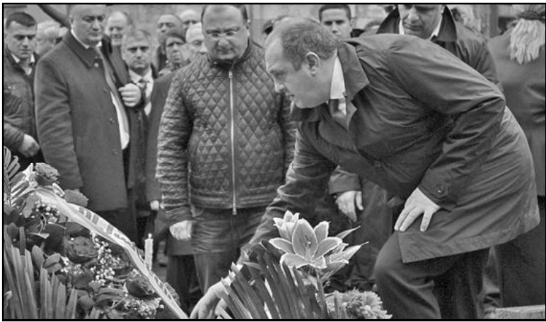
საბარტამელოზი პრეზიდენტი გიორგი მარტაველაშვილი ყოული შარტავას 70 წლის იუბილესთან დაკავშირებით, ვაკის სასაფლაოზე მივლინა და ეროვნული გმირის სსოვნას პატივს მიაგო.

როგორც გიორგი მარტაველაშვილი ურნაღისტიტეს განუცხადა, ყოული შარტავასთან ერთად ის პატივს მიაგებს იმ ადამიანების სსოვნას, ვინც სისხლი დაღვარა აფხაზეთის ტრაგედიაში.