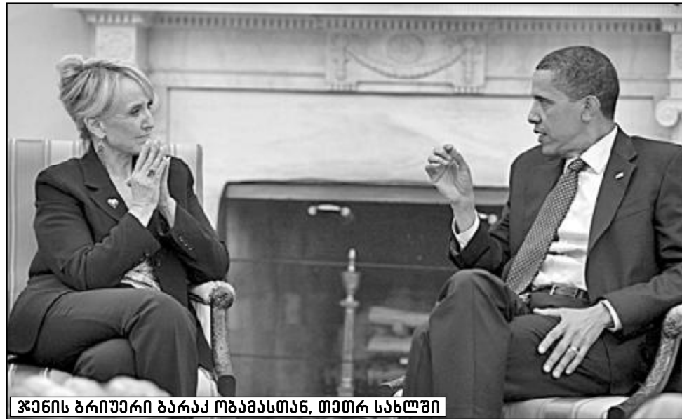
ჯენიზ ბრიუერი ბარაკ ობამასთან, თეთრ სახლში

რესპუბლიკელთა წარმომადგენელმა სტივ მონტენეგრომ დაიცვა ამ კანონის საჭიროება გაზეთ „არიზონას რესპუბლიკაში“ („არიზონა რესპუბლიკა“): „ჩვენ ვცდილობთ ადამიანების რელიგიური უფლებების და თავისუფლების დაცვას. არ გვინდა, რომ მთავრობა ვინმეს აიძულებდეს, თავისი ღრმა რელიგიური რწმენის საწინააღმდეგოდ იმოქმედოს.“ დეპუტატის აზრით, ამგვარად შესაძლებელი იქნება მაგალითისთვის მომა-