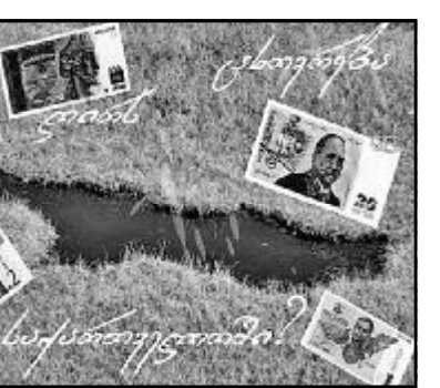
სადურისთვის მთავარი რეიტინგი ქვეყნის ეკონომიკური განვითარებაა და საერთო კეთილდღეობის მაჩვენებელია.

არადა, საქართველოს მთავრობა ამტკიცებს, რომ მათი მთავარი პრიორიტეტი მოსახლეობის ცხოვრების დონის მკვეთრად გაუმჯობესებაა. ფინანსთა მინისტრ ნოდარ