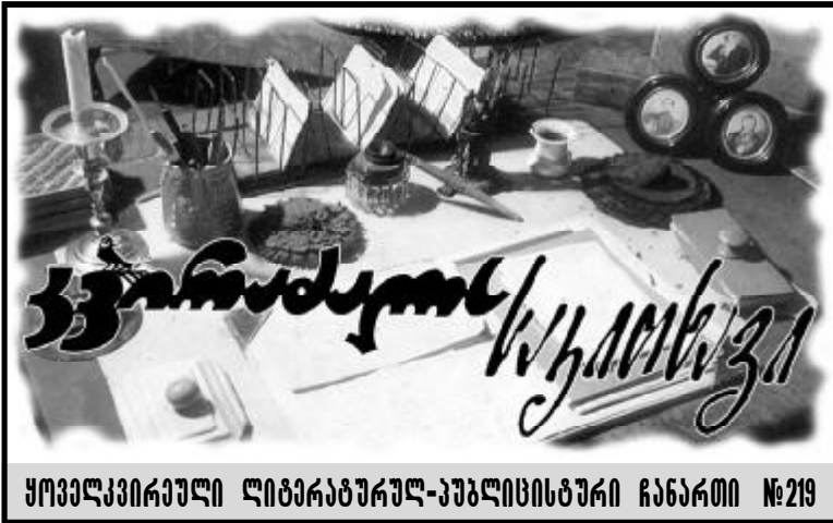
ყოველკვირული ლიტერატურულ-პუბლიცისტური ჩანაწერი №219