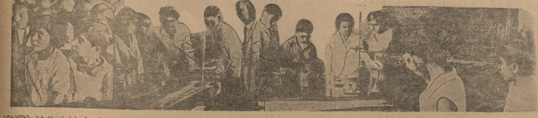
სკოლაში: პირველი მარჯვნივ: მე-30 სკოლა ხაშურის სკოლა, მთავარი ბავშვების უმეტესობა პირველი კლასის ბავშვები. მე-14 სკოლა ხაშურის სკოლა, მე-18 სკოლა ხაშურის სკოლა, მე-48 სკოლა, ალექსანდრის სკოლა