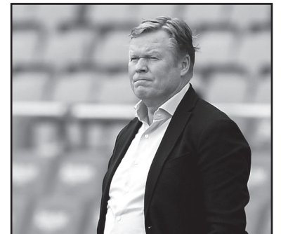
ამერიკიდან თავი უკეთესი მუშაობით უნდა გამოიჩინოს.

ამასობაში ხელმძღვანელობამ რონალდ კუმანი გააფრთხილა, რომ გასულ სეზონში დაფიქსირებული შედეგები საკმარისი აღარ იქნება. გუნდში კარგი ატმოსფეროა, წინასასეზონო მზადება სწორი ინტენსივობით მიმდინარეობს. თუმცა, ახალი სეზონის წინ, ვარჯიშების დანაწილების პირველივე დღიდან, კუმანი და მისი სამწვრთნელო შტაბი აცნობიერებენ, რომ ეს სეზონი, შესაძლოა, მათთვის გადამწყვეტი გამოგვს. შესაბამისად,