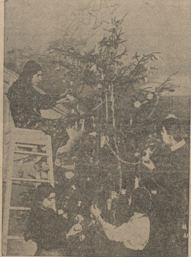
სკოლაში: ძემა სკოლის პირველი (მარჯვნივ) და მეორე (მარჯვნივ) კლასების ბავშვები, რომლებიც ახალწლის სახალისი მოწყობისთვის არიან შეგროვებული.