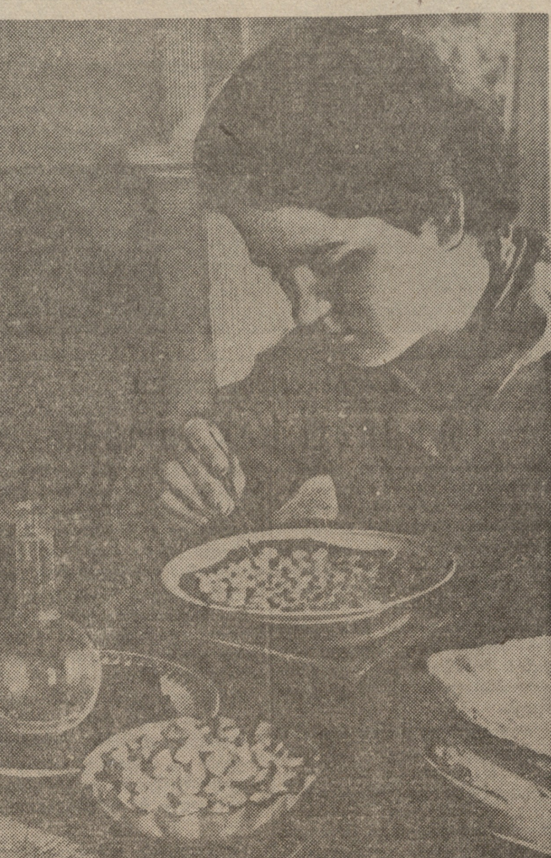
ოკუპანების აგრესიული მხარდობის საფუძვლიანი დაფუძნების მიზნით...