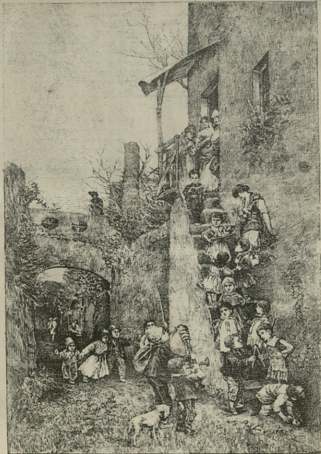
იტალიაში შობის დღესასწაული