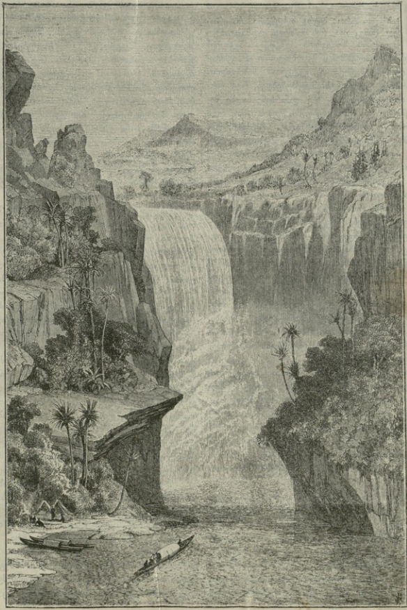
მ. ბრუნიანის ნახატი.

ლი მარამობისთვის დამლევაძღ ნილოსის სათავე- ში ყოველ დღე კოკის პირული წვიმა მოდის. ამ წვიმას ტროპიკული წვიმა ეწოდება და ნილოსის ადიდების მიზეზიც ეს წვიმებია.