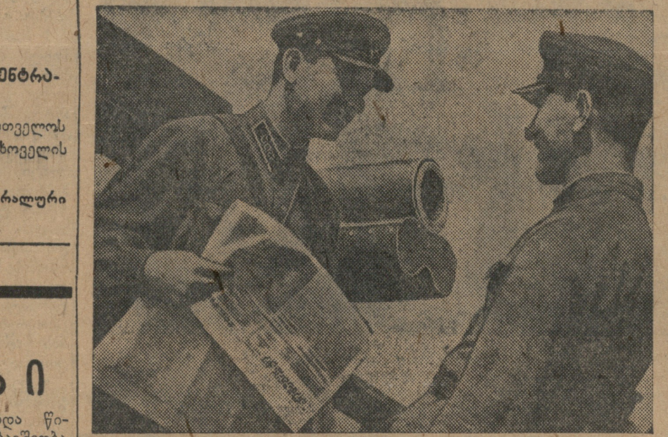
პრეტელიანის არტიკლისტი აბ. ბერიასი...