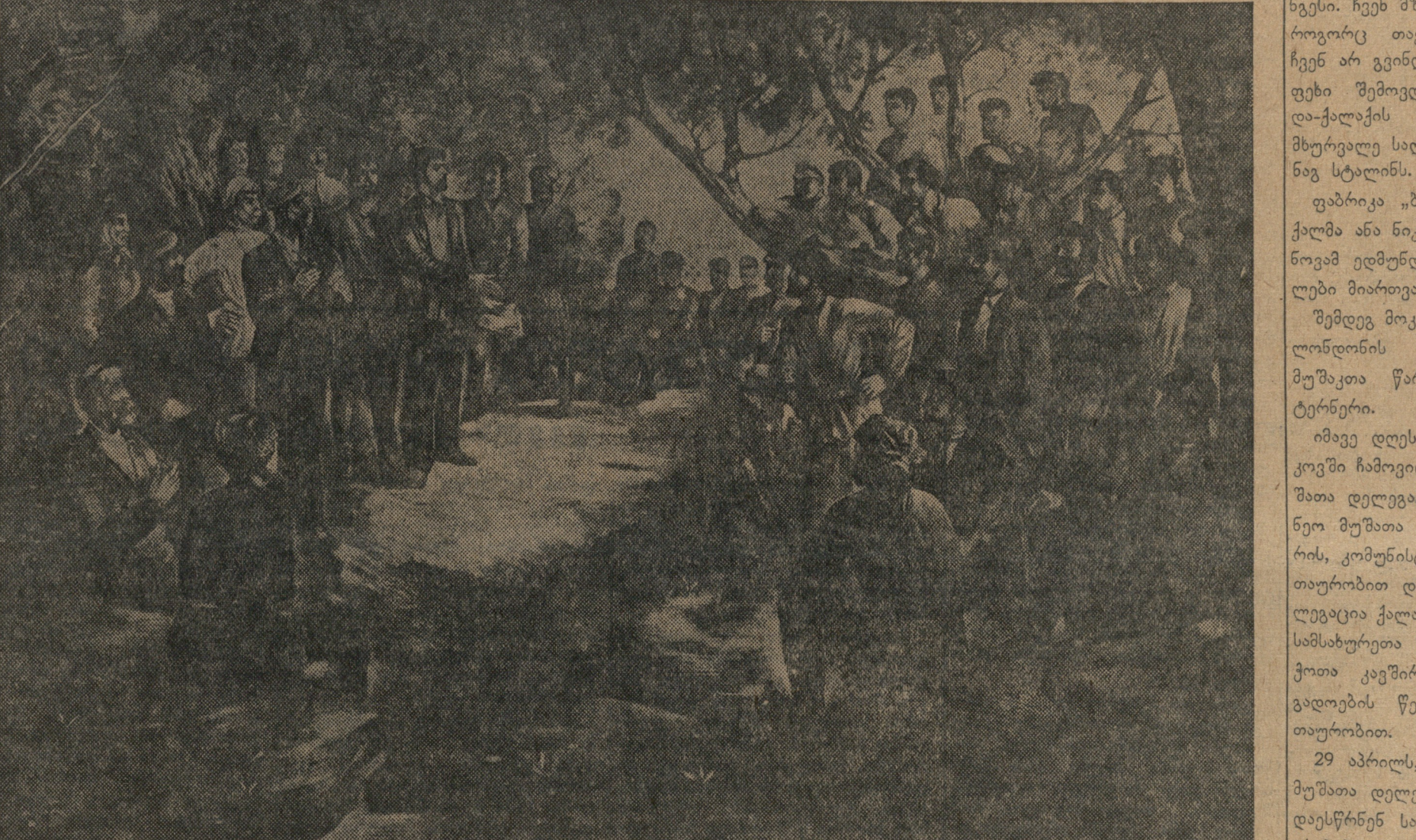
პირველი მაისობა თბილისში ქალაქბარდით 1901 წელს. ახსნაში სტალინი ახროს სიტყვას რეპრეზენტა მხატვარ მისიშვილის სურათიდან.