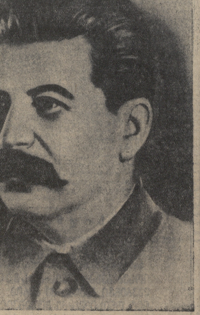
საქართველოს სსრ უმაღლესი საბჭოს არჩევნების ქალ. თბილისის ლენინის საარჩევნო ოლქის № 1 საოლქო საარჩევნო კომისიისა საპარტიო მდიანი სსრ უმაღლესი საბჭოს დეპუტატობაზე კანდიდატად

ამაზე სტალინი, მთელი მსოფლიოს მშრომელთა დიდი ბელადი, მთელი ქართველი ხალხის პირველი კანდიდატი საქართველოს სსრ უმაღლესი უმადლესი საბჭოს დეპუტატობაზე, — დათანხმდა კენჭი იყაროს ქალაქ თბილისის ლენინის საარჩევნო ოლქში.