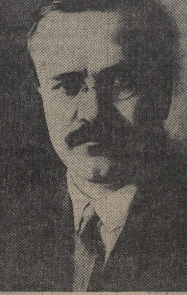
საქართველოს სსრ უმაღლესი საბჭოს არჩევნების ქალ. თბილისის სტალინის საარჩევნო ოლქის № 8 საოლქო საარჩევნო კომისიისა საპარტიო მდიანი სსრ უმაღლესი საბჭოს დეპუტატობაზე კანდიდატად