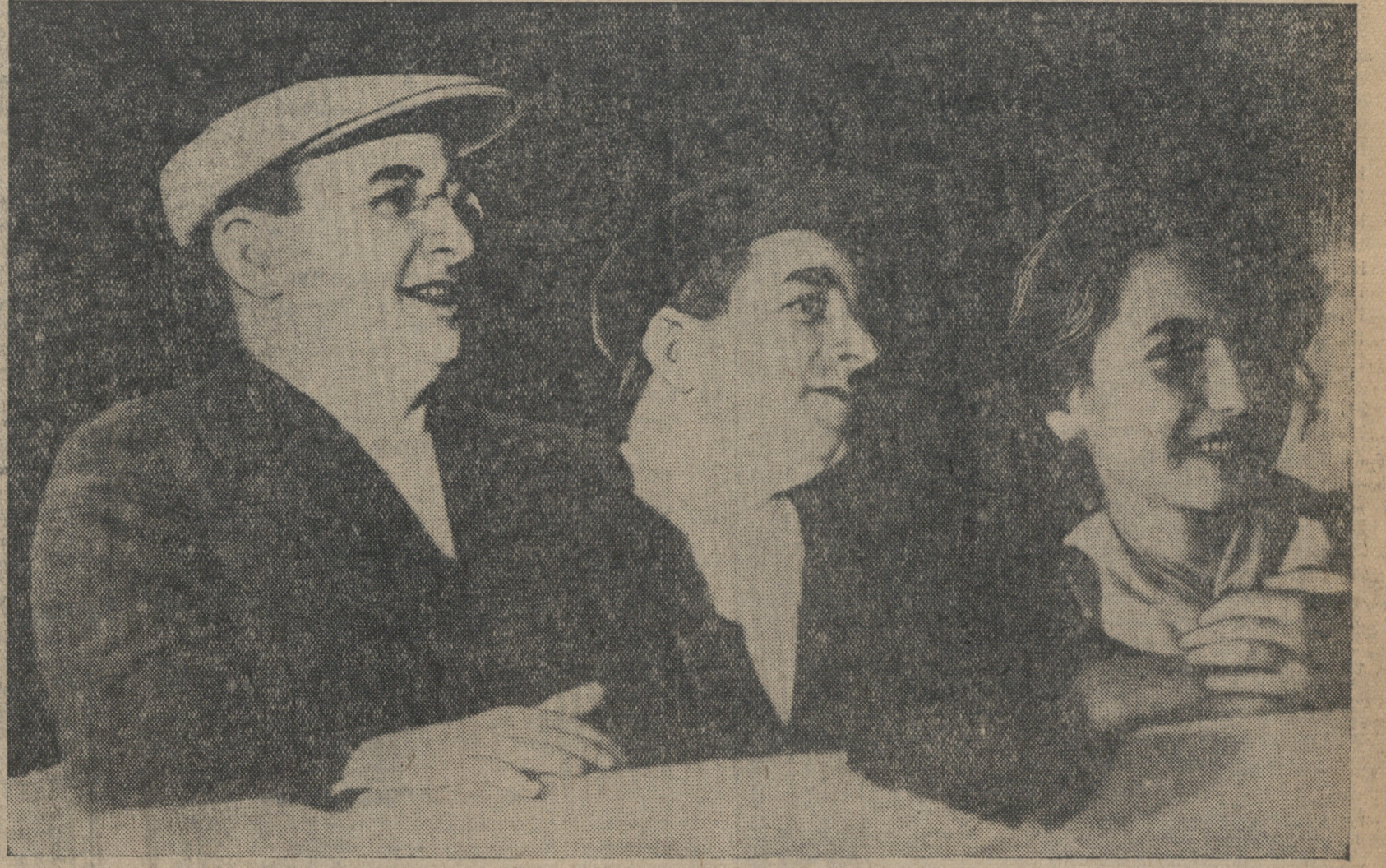
ამ-სამასისის ფელაქიის მოვლანი. ტრიხუნა — ახსნა სტალინს ლენინის ბერი, მ. სურუა და სხვ.

ქვეყნის ხმები და საქართველოს სსრ-ის უმაღლესი საბჭოს არჩევნების აღსანიშნავად, მსურველ ხალხს მსოფლიოში ყველაზე უფრო დემოკრატიული სოციალისტური კონსტიტუციის შემოქმედმა, რომელმაც ბედნიერება და სიხარული შეუქმნინა ჩვენი თვალწინ საბჭოთა მშრომლებს. დღეს მთელი ქართველი ხალხი შეიმოსხა კომუნისტებისა და უპარტიოების სტალინურმა ბლოკმა ბრწყინვალე გამარჯვება მოიპოვა საქართველოს სსრ-ის უმაღლესი საბჭოს არჩევნების ყველა 287 საარჩევნო ოლქში. უსაზღვრო ბედნიერებასა და სიამაყეს გრძობთ არის გამსჭვალული ორდენისანი საქართველოს ყველა მშრომლის გული, რომელთაც წილად მხედით დიდი პატივი—რესპუბლიკის ხელისუფლების უმაღლეს ორგანოში თავის პირველ რიგულად მუშავებ დიდი სტალინი—ვის, ვინც თავისი ბრძოლი ხელმძღვანელობით მიიყვანა სსრ კავშირის ხალხი თავისუფალ, ბედნიერ, კულტურულ ცხოვრებაში, ვისაც მტკიცედ მიჰყავს ჩვენი ქვეყანა წინ, კომუნისტების, ვისი სახელით წარმოადგენს მთელი მსოფლიოს მშრომელთა და ჩაგრულთა ბრძოლის დროშას და განთავისუფლების სიმბოლოს. ძვირფასო და მშობლიური ოსებ ბესარიონის-ძე! მთელმა ქართველმა ხალხმა, ჩვენ ყველამ კარგად ვიცით თუ რას გვაპაუტებს ეს უდიდესი პატივი, ეს დიდი ნდობა, და სიტყვას ვაძლევთ თქვენ, რომ გავამართლებთ მას ჩვენი დაუღალავი მუშაობით კომუნისტების მშენებლობის ყველა დარგში. ნა მისცა რა კომუნისტებისა და უპარტიოების