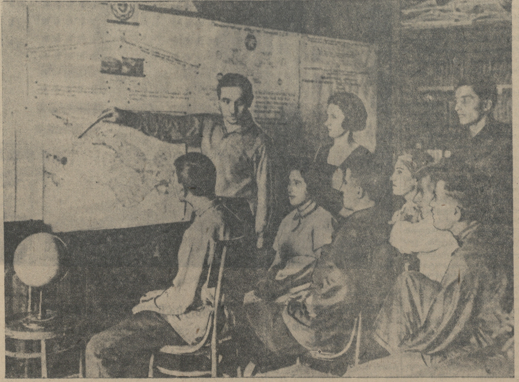
თბილისი. მუდს დაბრუნების აგენტები ამ. ცაგარელის საქ. კ. პ. (ბ) ორგანიზაციის მუშაობის შემსწავლელი წრის მდიანობის რეკონსტრუქციის იმ ადგილებს, სადაც ამხანაგი სტალინი იწვინა რევოლუციური მოღვაწეობის.

მცირერიცხოვანი პარტიული ორგანიზაციის საინფორმაციო კრებებზე მკაცრად გააკრიტიკეს რაიკომის ხელმძღვანელმა ამ პარტიული ორგანიზაციებისადმი. საინფორმაციო-საინფორმაციო კრებებში პარტიული ორგანიზაციის მუშაობის დასახელებები ახსნა. მათში პარტიული ორგანიზაციის მუშაობის დასახელებები ახსნა. მათში პარტიული ორგანიზაციის მუშაობის დასახელებები ახსნა.