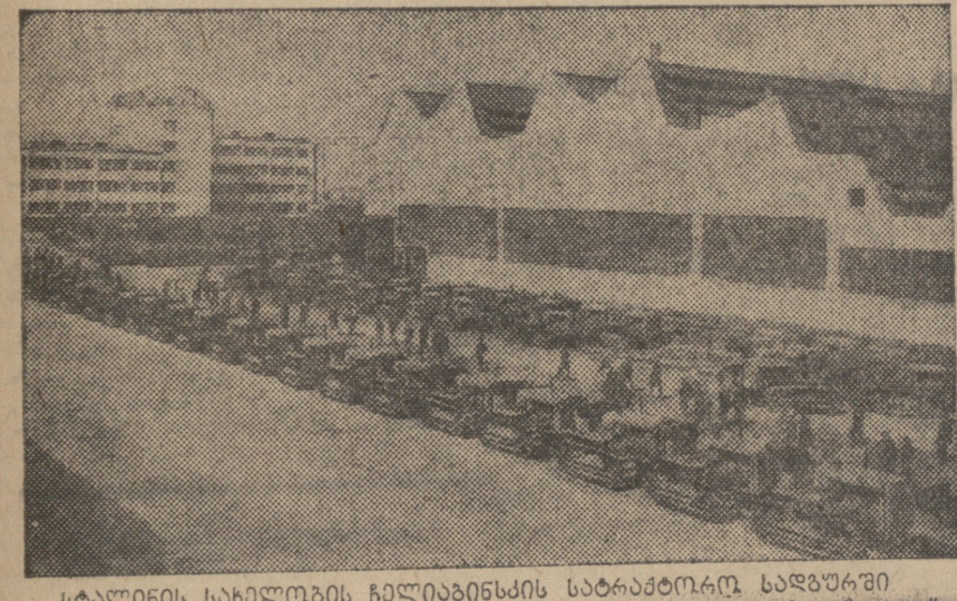
სტალინის სახლის მშენებლის საბჭოთაო სხადარში