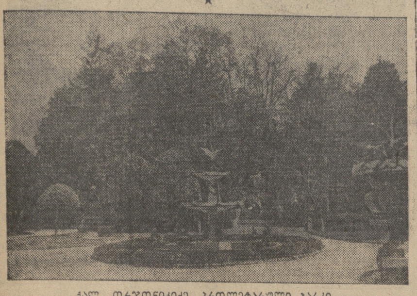
მ. ბ. ბრეჟნევი, პარკის მშენებელი სობორი