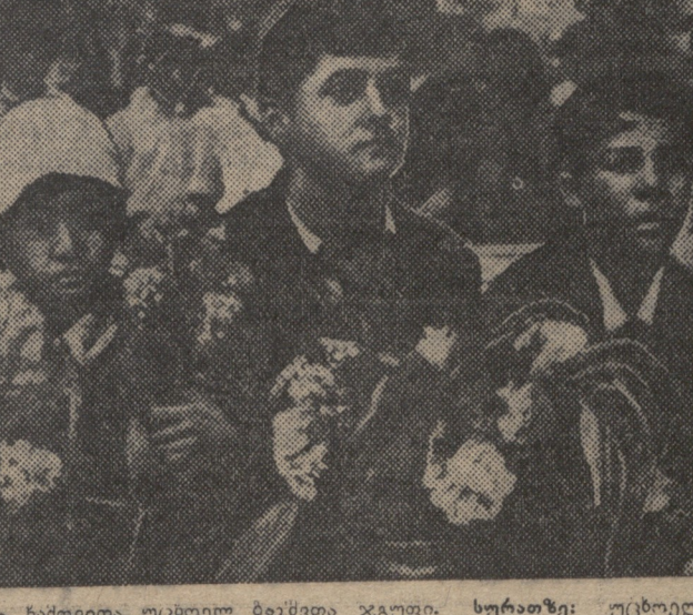
გაბრიელ ბერიძის ფოტოგრაფია...