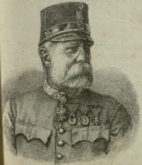
ერც-ლერცოგი კარლოს ლუდვიგი ავსტრიელი.

Q ი დროს, როდესაც ევროპის ხალხი და მასთან მთელი ავსტრიის სახელმწიფო ათასი წლის არსებობას დღესასწაულობდა ევროპის ერც-სას, მისმა სამხერატორა სახლმა დიდი მწუხარება და დასაკლისი გამოკადა. მას მოუყვდა მემკვიდრე ავსტრიის იმპერატორისა ერც-ლერცოგი კარლოს ლუდვიგი, რომელიც დაიბადა 1833 წელს. ავსტრიის იმპერატორის, ფრანც-იოსების შვილი რომ უმემკვიდრეთ გადავიდა, მას შემდეგ მამ იმპერატორისა კარლოს ლუდვიგი გამოცხადებულ იქნა იმპერატორის მემკვიდრეთ. მან მომეტებული ნაწილი თავის სამსახურისა უცხო ქვეყნებში გაატარა ავსტრიის სახელმწიფოს წარმომადგენლათ. ის ძალიან განათლებული კაცი იყო და ვენის აკადემიის საპატიო წევრათ არჩეული. მას უყვარდა კავალერია და როგორც ავსტრიის კავალერიის მხედრათ მთავარმა დიდი ვაჟმჯობისება მოახდინა ჯარში. ამ ბოლოს დროს მან განიზარება აღმოსაუღეთის ქვეყნებში მოგზაურობა, იქ ვახდა ზაშვიანი ციფებით ავათ ჭ რომ დაბრუნდა, მას შემდეგ დიდ ხანს აღარ უტოცხლია; იქილამ გამოყოლილმა ავთმყოფობამ თან გადიტანა.