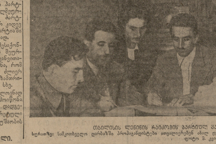
თბილისის ლენინის რაიონის პარტიული კრება...