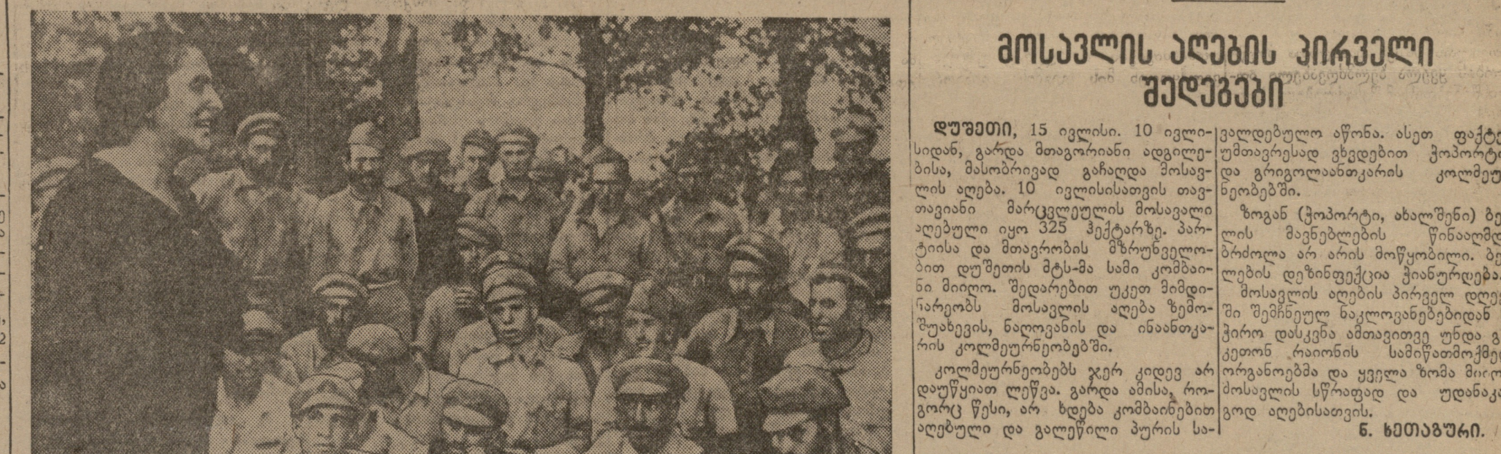
ფაშისტი ინტერენტივის წინააღმდეგ ეხანეთის ხალხის გმირული ბრძოლის ორი წლისთავი...