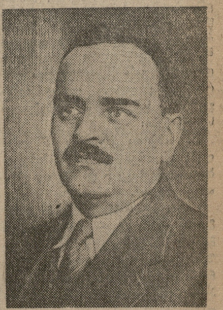
სსრ უმაღლესი საბჭოს პრეზიდიუმის თავმჯდომარე 8. კალინინი

ერთობლივად, „მ-1“ პირველი მოწვევის უმაღლესი საბჭოს პირველი სესიის (1-ლი გვ.) გადაწყვეტილებით, მისი ღვაწლი აღიარებულია მისი ღვაწლი. მისი ღვაწლი აღიარებულია მისი ღვაწლი.