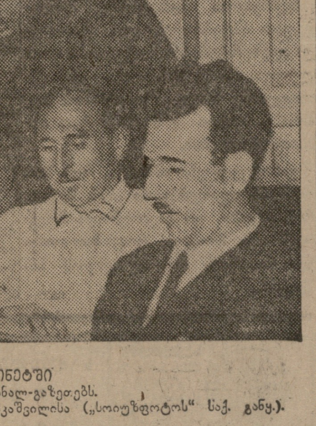
რეზოლუციის განხილვის შესახებ...