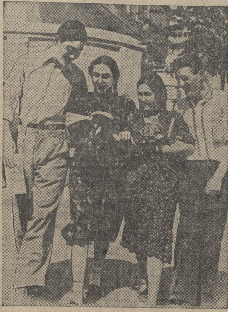
მე-109 საშუალო სკოლის მოსწავლენი სინჯავენ ახალ სახელმძღვანელოებს.