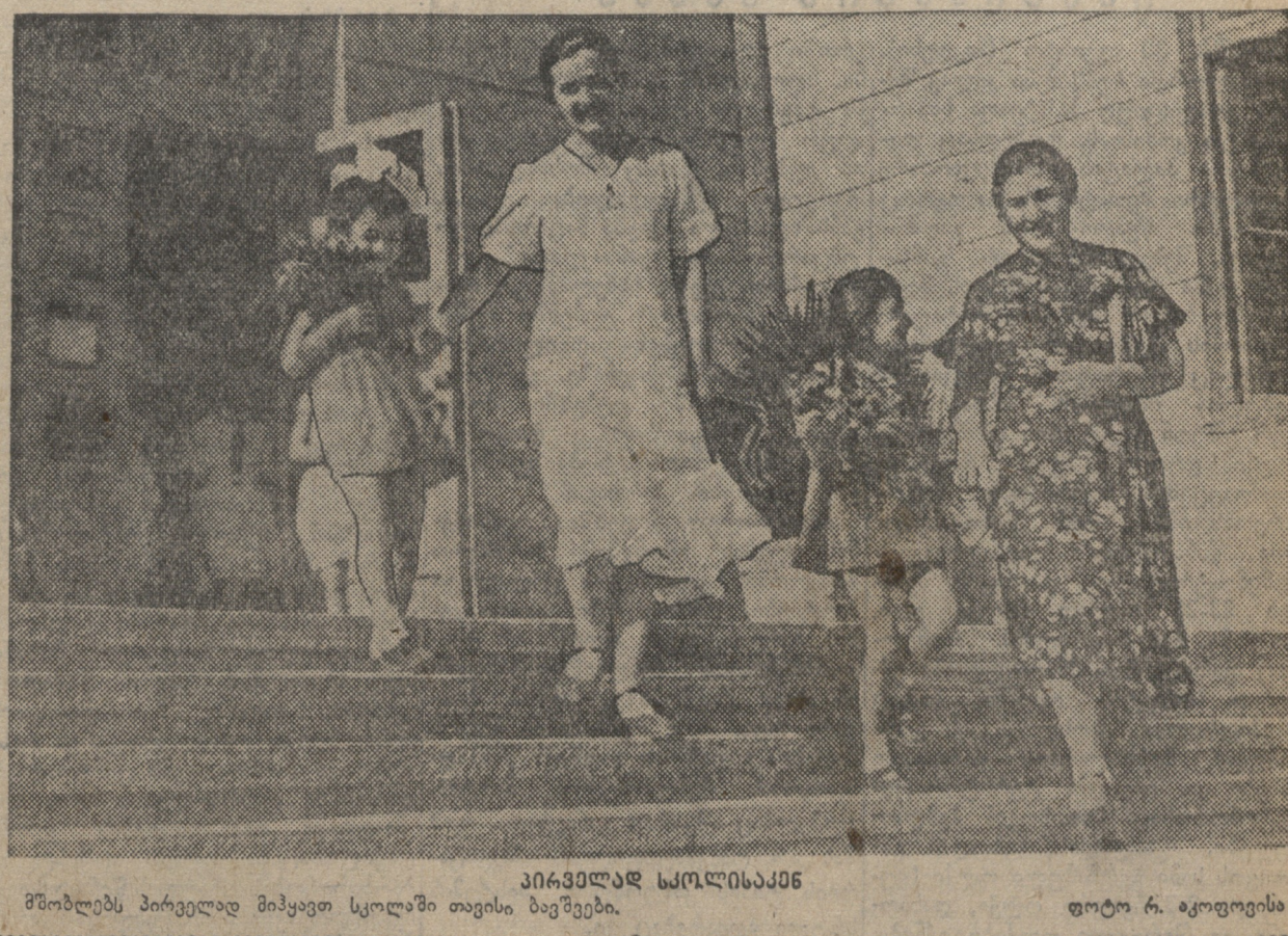
მშობლებს პირველად მიჰყავთ სკოლაში თავისი ბავშვები.