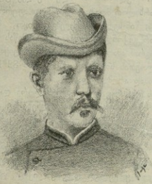
ნ ა ნ ს ე ნ ი.

ნ ანსენის ექსპედიციამ და თვით ამ შესანიშნავი და გამებდვი მოგზაურის პიროვნებამ სწავლულების მხრით, არამედ მთელ კაცობრიობის. ამიტომ მოგვეყავს აქ საინტერესო ცნობები მის შესახებ.