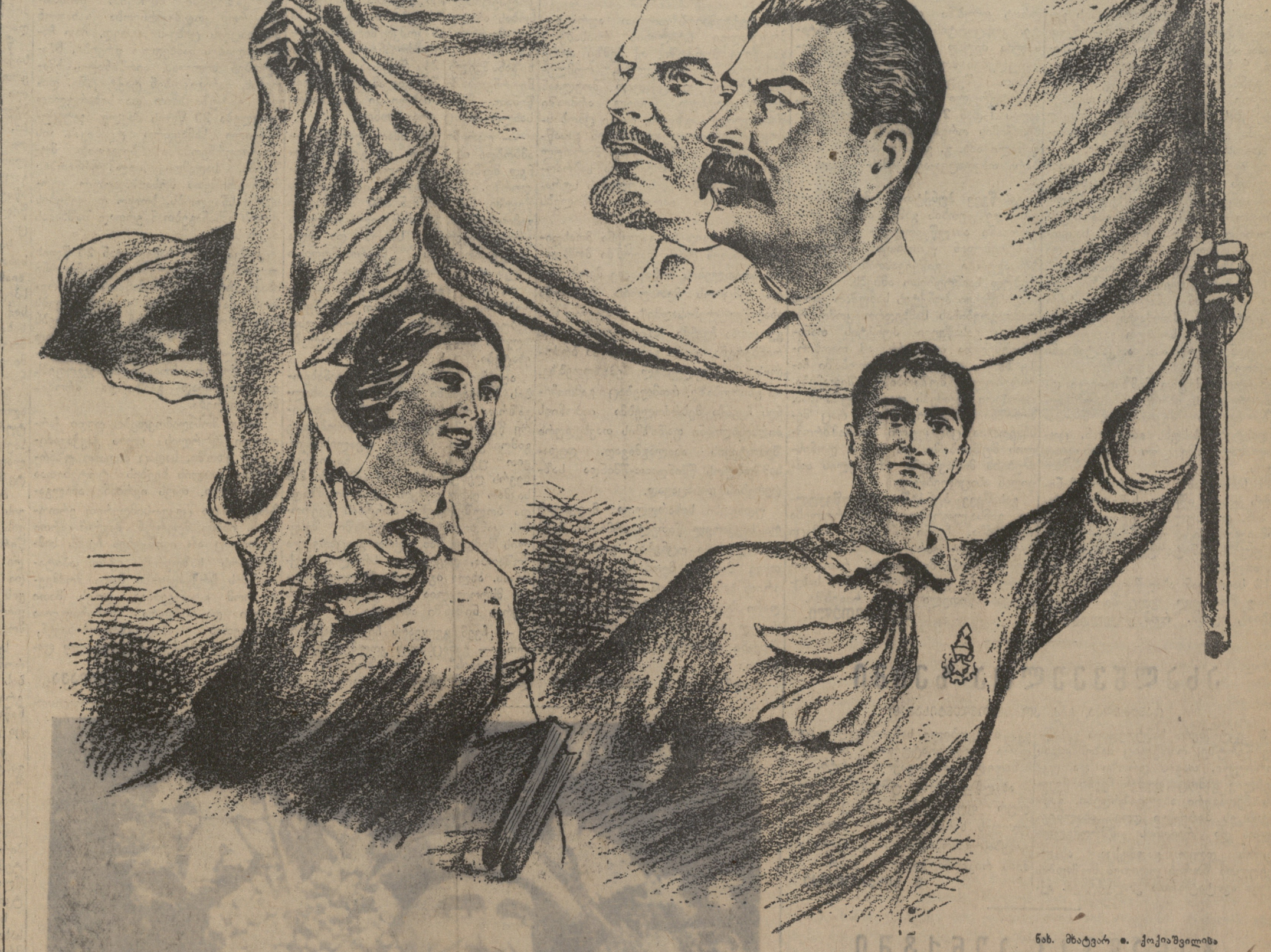
ნახ. მხატვარი კ. კვიციანი