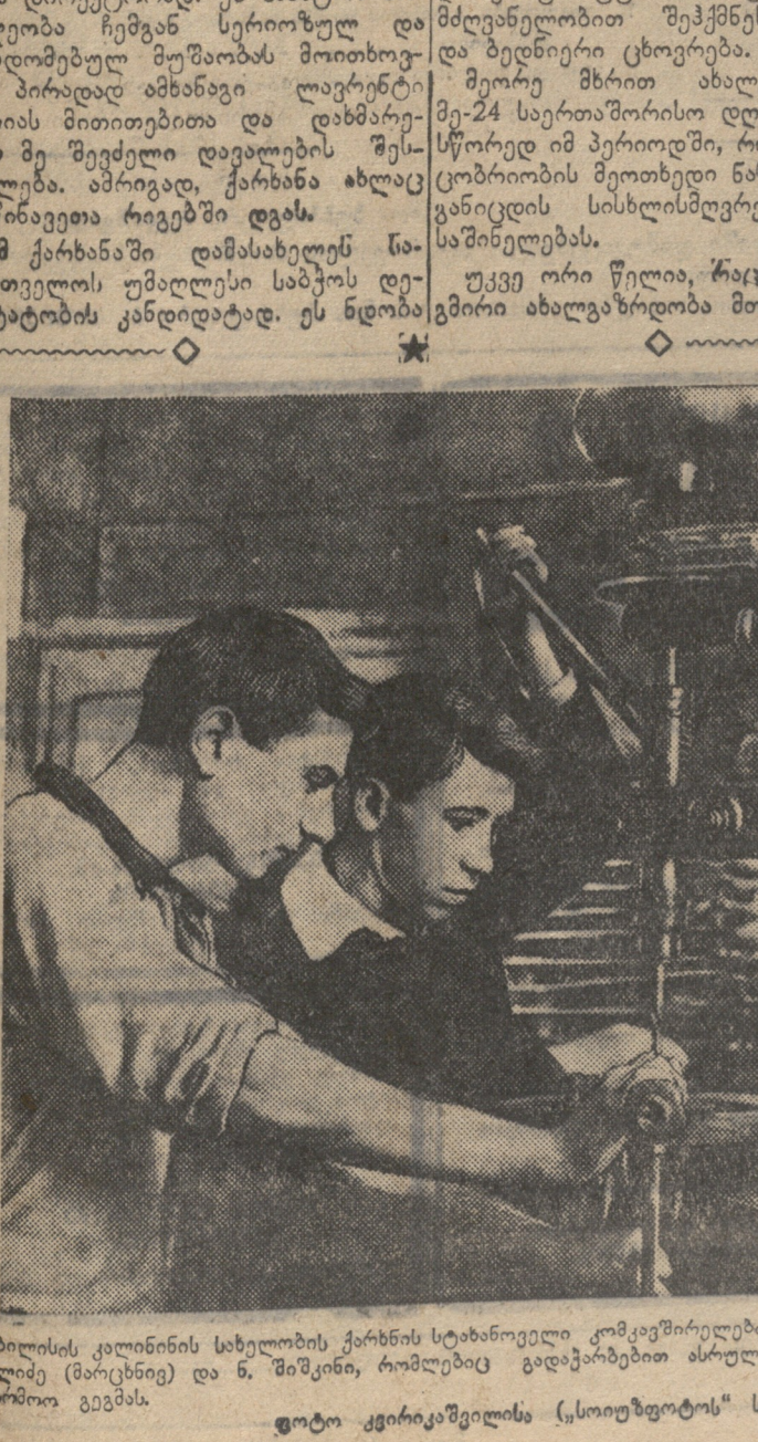
თბილისის კომუნისტური სკოლის ქარხნის სტახანოვილი კომპოზიციის ხელმძღვანელი (მარცხენა მხარეს) და მ. შიშინი, რომლებიც გადამარბობენ ასრულებენ საბჭოთა დღესასწაულს.