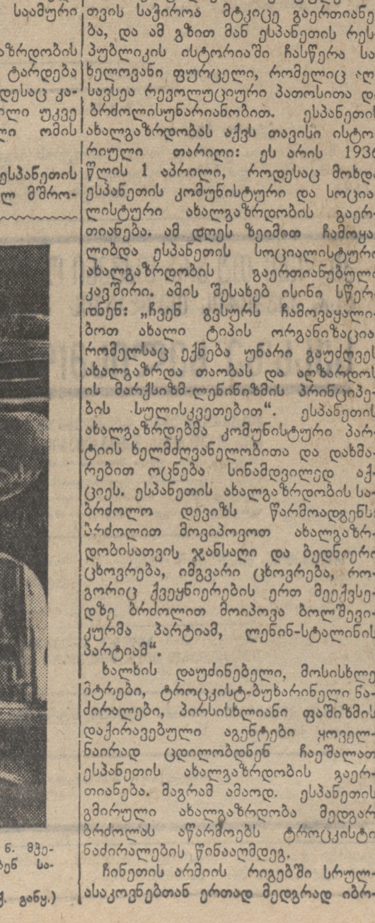
თბილისის სტალინის სახელობის სახელმწიფო უნივერსიტეტის ფრანკო ფილიპის სტუდენტების ერთი ჯგუფი.