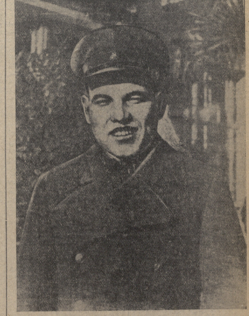
სსრკ-ის პარტიის ცენტრალური კომიტეტის წევრი, საქართველოს პარტიული კომიტეტის პირველი მდივანი...