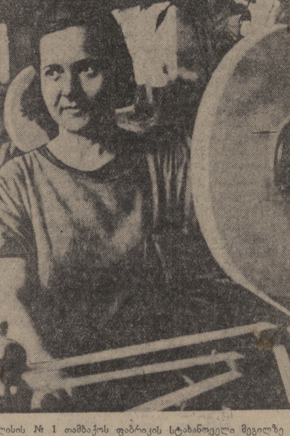
თბილისის № 1 თამბაქვის ფაბრიკის ტექნიკური მუშაკი...