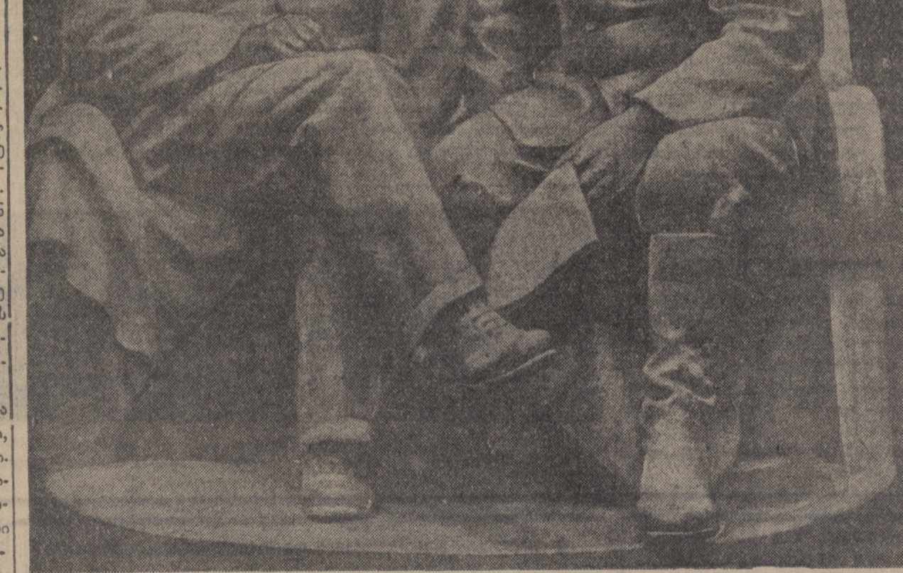
ვ. ი. ლენინი და ი. ხ. ბაქალინი გორაკში

აღაპავეს, (საქდესი). კონი-შევის სახელობის რაიონის სადგურ კინელოდან 30 კილომეტრ მანძილზე გაშენებულია სოფელი აღაპავესი. 50 წლის წინათ, 1889 წელს, ამ სოფლის მახლობლად მდებარე ბეტონში დაშენდა ვლადიმერ ილიას-ძის სახლი. ის მაშინ 19 წლისა იყო. ბეტონში იგი ყოველ ზაფხულს ატარებდა, ზამთრით კი სიმირის მიმდებარეობდა. იმ წლებში აღაპავესის მახლობლად ტყეები იყო. ულიანოვის პატარა ხის სახლი მდებარეობდა აქ. იგი ჩაფლულია, ამ სახლს კერა ხშირი, მიღებული ბაღი. ლენინი ყოველდღობით მოდიოდა ბაღში წინგნობით და რევოლუციით და სსრ-ტრეპტურად მუშაობდა საიდამდე. ვლადიმერ, ილიას-ძის აქ რაღაც ტრეპტების მავარი მოაწყო და ტრეპტარ-ჯიშობით იყო გაბოთული. ტრეპტარ-ჯიშობა და ტბაში ბანაობა მისი საყვარელი დასვენება იყო. ლენინი ბევრს მუშაობდა. იგი გულმოდინედ სწავლობდა მარქსსა და ენგელსს, აწარმოებდა მიწერ-შეწერას სხვა ქალაქების მარქსისტებთან. აღაპავესის მახლობლად მდებარე ბეტონში ყოფნის უკანასკნელ ხანებში ახალგაზრდა ლენინი უკვე ცნობილი იყო, როგორც ჩამოყალიბებული მარქსისტ-რევოლუციონერი. როცა ულიანოვი ბეტონიდან წაიღებინ, აღაპავესის სინიარბობა სახლი სხვა სოფელში გაჰყარა და ბაღი გასჩენა. აღაპავესში წმინდად ინახავენ ვლადიმერ ილიას-ძის ლენინის ხსენას. მათ ულიანოვის სახლი წინანდელ ადგილზე გადართანეს და 1932 წელს მოახდინეს მისი რესტავრირება. ლენინის სახლ-მუზეუმში ახლა მუშაობს ბიბლიოთეკა-სამკითხველო, რომელშიც ითვლება 5 ათასი ტომი. 212 კომუნისტური მისი მუდმივი მკითხველია. ფოტოლაკატები და ისტორიული დოკუმენტების ასლები მოგვითხრობენ კაცობრიობის გენიოსის ცხოვრებასა და რევოლუციურ მოღვაწეობას.