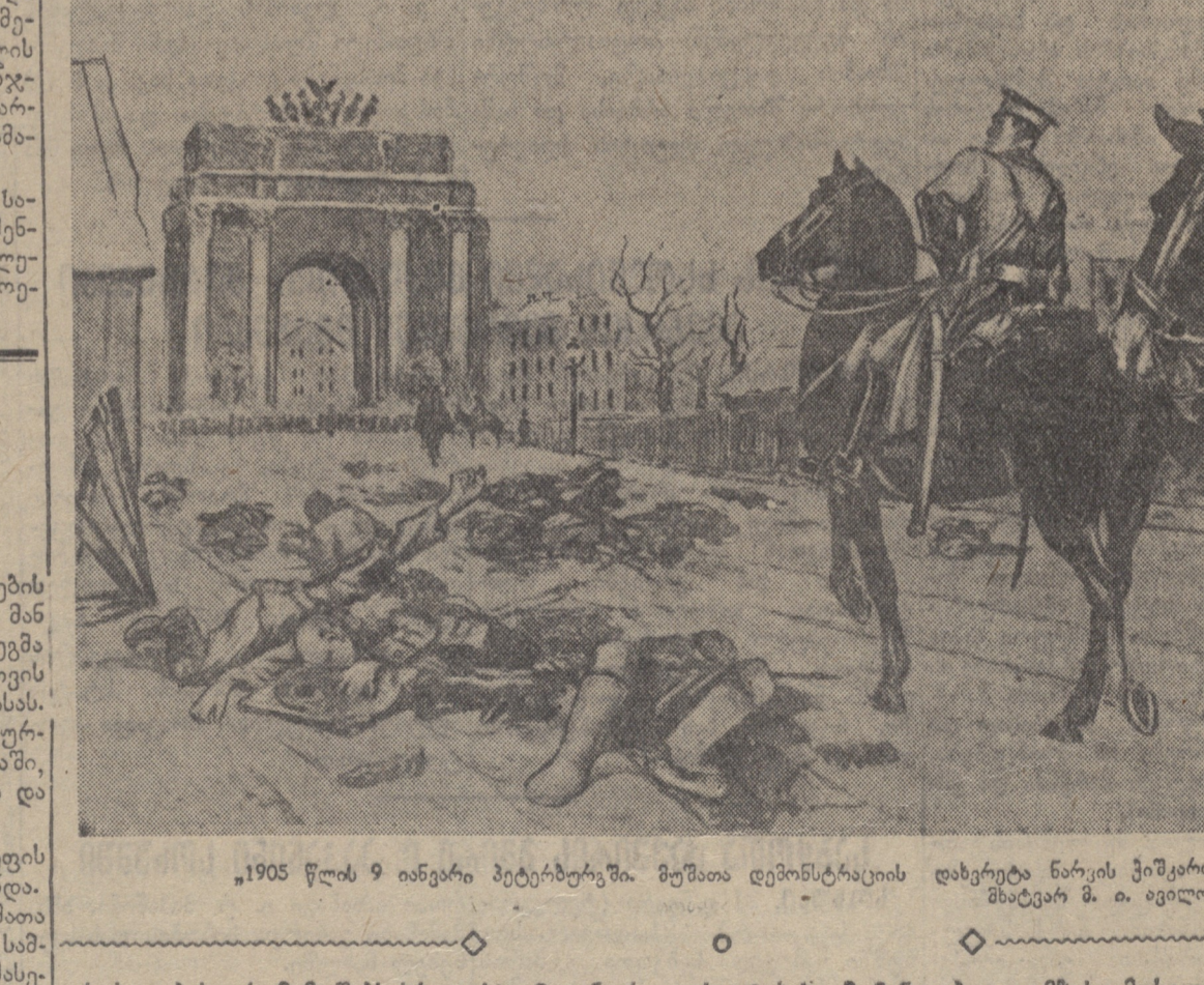
1905 წლის 9 იანვარი პეტერბურგში. მუშაკთა დემონსტრაციის დახრება ნარის ქვიშაში.