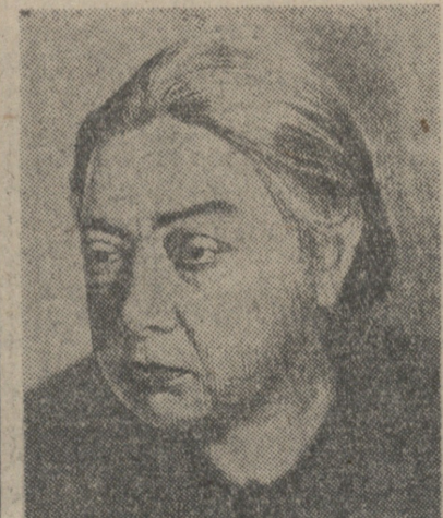
სახანოვური კავშირის სახლის სკვანდინ რაბაზში...