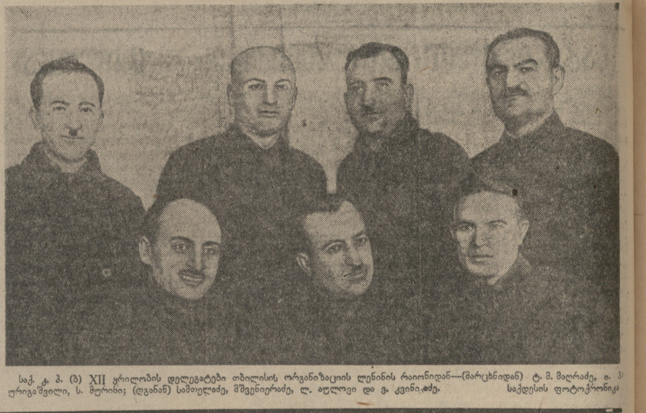
სახანოვური კავშირის სახლის სკვანდინ რაბაზში...