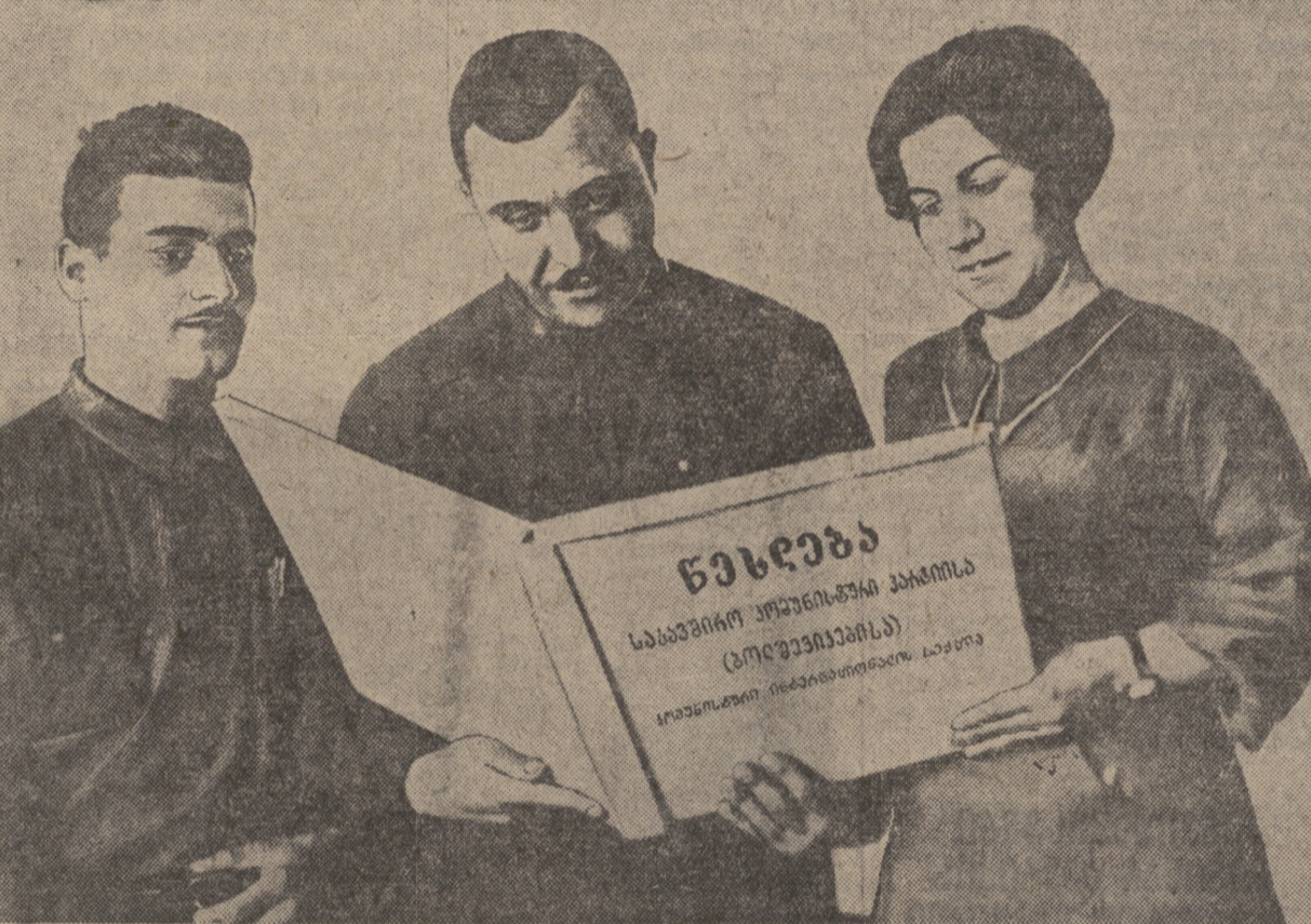
თბილისის სტალინის სახელობის საბჭოში უნივერსიტეტის პარტიული ორგანიზაციის ბიუროს მდიანი.