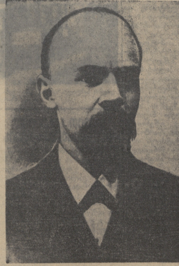
ვ. ი. ლენინი პარტიის მეორე ყრილობის პერიოდში.