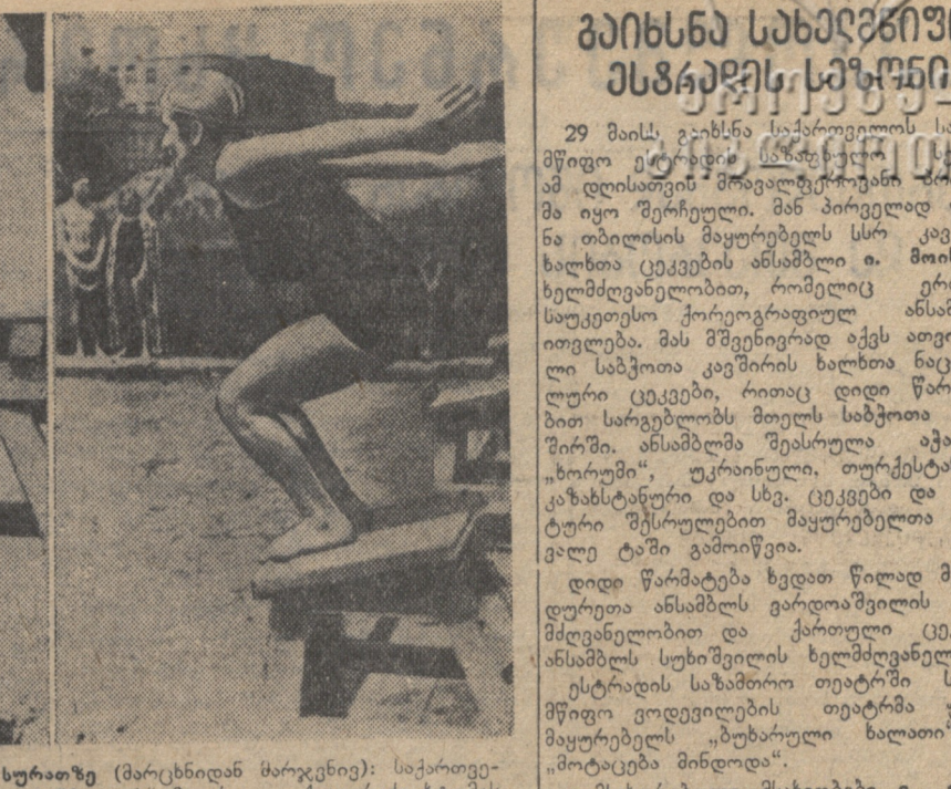
გუნდმა გაიხსნა წყალგამობის ახალი თბილისის ფელეტური პარტი...