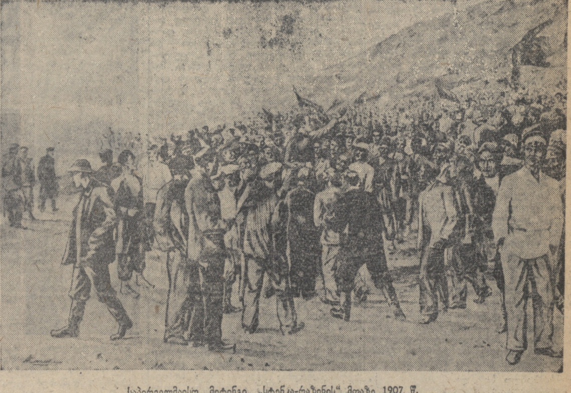
საბრძოლველად მიტინგი „სტენკა-რაზინის“ მთაზე 1907 წ.

„ბაქოს გოლგოთაში ორგანიზაცია, რომელიც უზუალოდ ხელმძღვანელობდა ამხანაგი სტალინი, კამპისი მძიმე წლებში ლენინური პარტიის უკანაში ციხე-სიმახე იყო. დიდი ლენინის ყველაზე უფრო ახლოგამი თანამშრომლის ამხანაგ სტალინის მიერ დანერგული სახელმწიფო გოლგოთაში ტრადიციებმა ბაქოს პარტიისათვის რაიონის კავშირის გამაჯობისათვის, პარტიისათვის დიდი მნიშვნელობის, სოციალისტური გამაჯობისათვის მოწინავე მხარეობა გამოავლინა.“ დ. ვ. ბერი