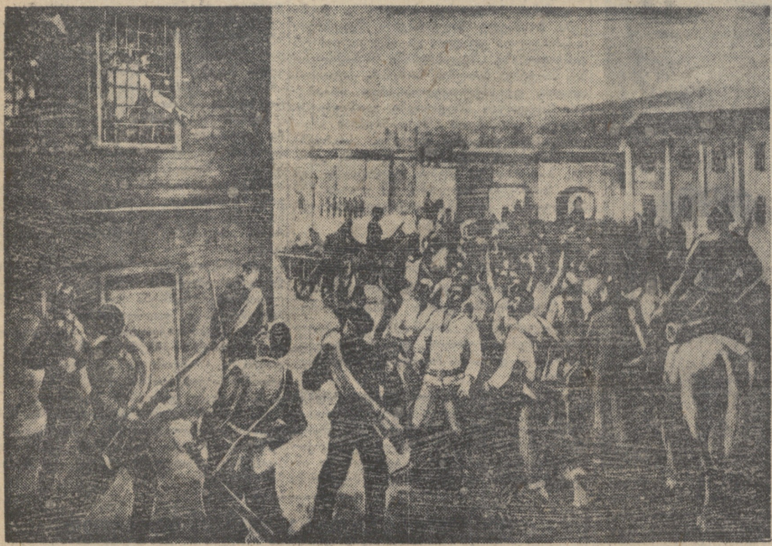
ყოველი ბაილოვის ციხე