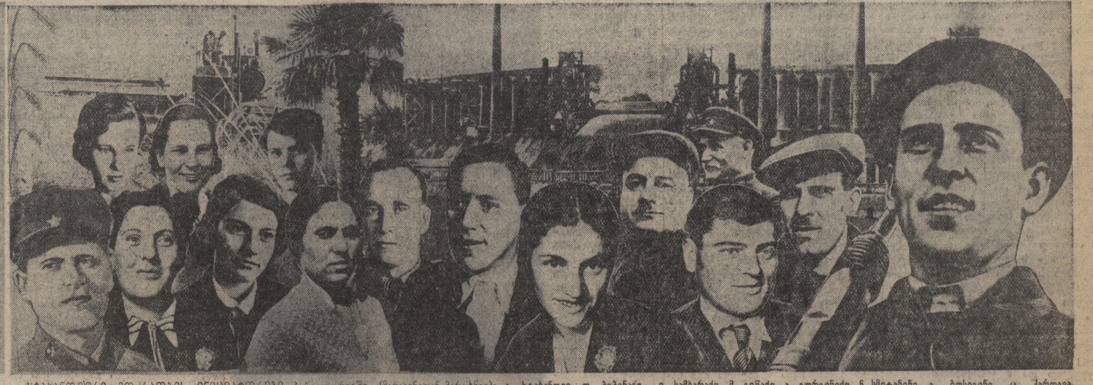
სტალინიზმის მოძრაობის ინიციატორები... (Caption describing the group of people in the image.)

ლესი სტალინიზმის წინააღმდეგ, 31 აგვისტოს ღამეს, ღამისას სტალინიზმის სახელმძღვანელო კენჭი ჩაიყარა... (Text continues describing the political stance and events related to Stalinism.)