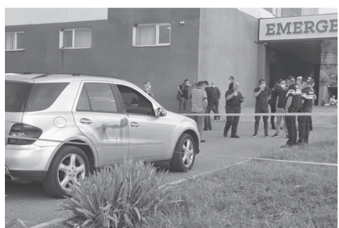
მეგობრები მათი მეგობრის დასახმარებლად მივიდნენ.

გარდაცვლილებს შორის არის პირი, რომელიც ზვიადაურისა და მისი მეგობრის მისამართით ისროდა. კონფლიქტი კი ერთ-ერთ მშენებარე ობიექტზე დაიწყო, სადაც ზვიადაური და მისი