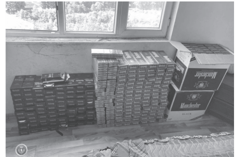
დაქვემდებარებული აქციზური საქონლის აქციზური მარკის გარეშე შენახვის და გადაზიდვის ფაქტებზე ორი პირი დააკავეს.

საქართველოს ფინანსთა სამინისტროს საგამოძიებო სამსახურის საგამოძიებო დეპარტამენტის აჭარის და გურიის სამმართველოს თანამშრომლებმა, გატარებული ოპერატიული-სამძებრო ღონისძიებებისა და საგამოძიებო მოქმედებების შედეგად, დიდი ოდენობით მარკირებას