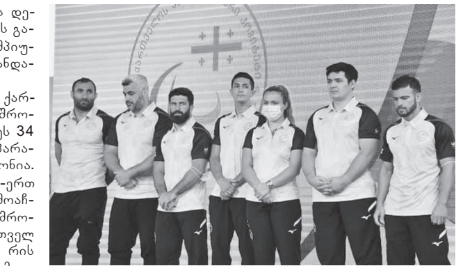
ბი ალკოპოლის ზემოქმედების ქვეშ იყვნენ. საქართველოს პარალიმპიური კომიტეტის განცხადებით, დამნაშავე დისკვალიფიცირებული იქნება და სასჯელსაც დამსახურებულად მიიღებს.

ქართველმა პარაპარალიმპიურმა 60 წლამდე ასაკის მამაკაცს დაზიანებები მიაყენა, რომელსაც დაცემისგან ნეკნი აქვს გატეხილი. პოლიციაში დაკითხვისას აღიარებით ჩვენებაში წაიჭებია, რომ დამნაშავე და მისი თანაგუნდელი-