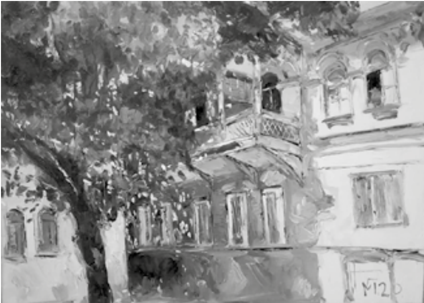
თეზოზ მიქონაცი „ძველი თბილისი“. ტილო, ზეთი 77/107

გამოფენის შესახებ კომენტარი ვთხოვე ცნობილ ადამიანებს: