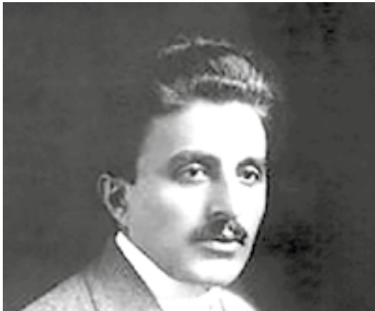
ემინ არ - რეიკვანი (XX საუკუნის ლიბანელი პოეტი)