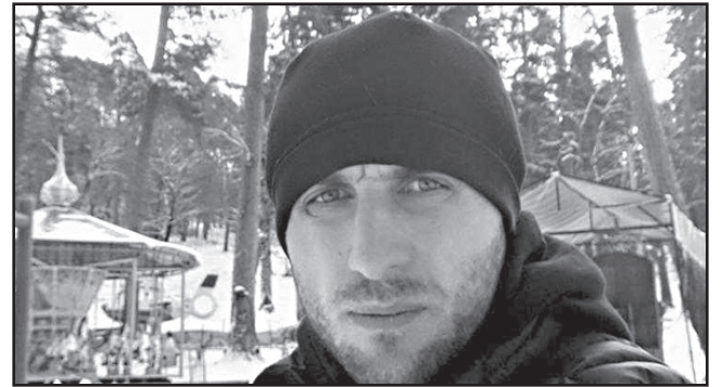
სამართალდამცველებმა რეაგირება ოჯახის სკანდალურ განცხადებების და ტვ პირველის რეპორტაჟების შემდეგ მოახდინეს.

რამდენიმე დღის შემდეგ თვითმკვლელობად მონათლული მკვლელობის საქმე თავდაყირა დადგა – ამური შველიძის გარდაცვალების ფაქტზე პოლიციამ ერთი პირი პოლიციის განყოფილებაში გადაიყვანა.