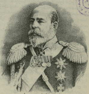
თავადი გრაგოლ სერგეის ძე გოლიცინი.

ჩვენში ის მესამოცე წლებში მსახურებდა პოლკოვნიკის ზარისხით და წინამძღვრობდა გრენადერის-ქართველ პოლკს. ახლა ის აღედა უმაღლეს ლენერ-