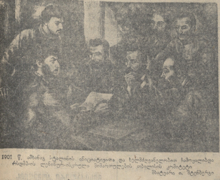
1901 წ. ანანა კვარციანი ინტელიგენცია და ხელმძღვანელობდა ჩამოყალიბდა

დიდს სტალინს საქმის დასრულების შემდეგ საბჭოთა კავშირის მშენებელი სტალინი იოსებ ვიშნისკის მიერ 1901-1902 წლებში მოხატულია სტალინი იოსებ ვიშნისკის მიერ 1901-1902 წლებში მოხატულია