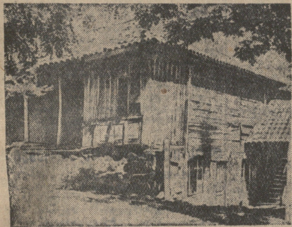
ქათურის რაიონი, სოფ. პერევისკა, 1905 წ. მოთხოვნილი იყო არაღვალაპო ბოლშევიკური სტამბა.