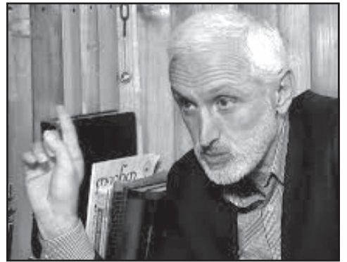
მივცემთ, არავითარი არჩევნები არ იქნება სამი წლის განმავლობაში.

— მე ღარიბაშვილის აშენებული ქვეყანა ვერ ვნახე, დანგრეული კი ვნახე. ვერ ვნახე ამ ცხრა წლის განმავლობაში აშენებული ვერც სიღნაღი და ვერც რაბათი. ვერც აშენებული ბათუმი ვნახე.