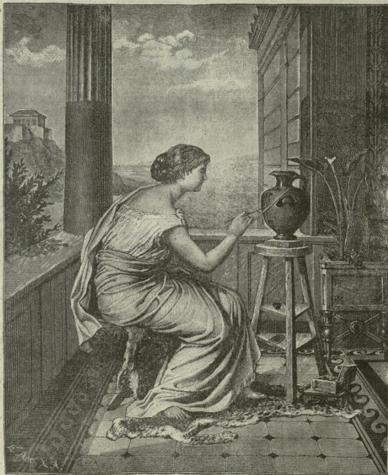
რომაელი მხატვარი ქალი.

ქარი, მაგრამ ფრინველი თვალსა და ხელს შუა სადღაც მიიმალა. ეწყინა მეფეს და გამობრუნებას აპირებდა ქუთაისისაკენ, მაგრამ ამ დროს წადგა მის წინ ეილაკ ახალგაზდა და მოახსენა: თქვენ რომ ხოხობი გავიფრინდათ ავერ გახლავთ ჩემ ვზოშიო. —მეფემ, მისი ბაზიერებით, შეაქენა —დაუწყო ძებნა, მაგრამ ხოხობი ეცრადნახა, მერე მიიხედა სახლისკენ და საჩემელთან მოჰკრა თვალი ერთ შვენიერ ქალს. —სად არის ბაეშო ის ხოხობი? მომატყუეო? — არა ჩემო ხელმწიფეო, — მიუგო ყმაწვილმა — ქაჯაიას გვარს მის დღეში მეფის