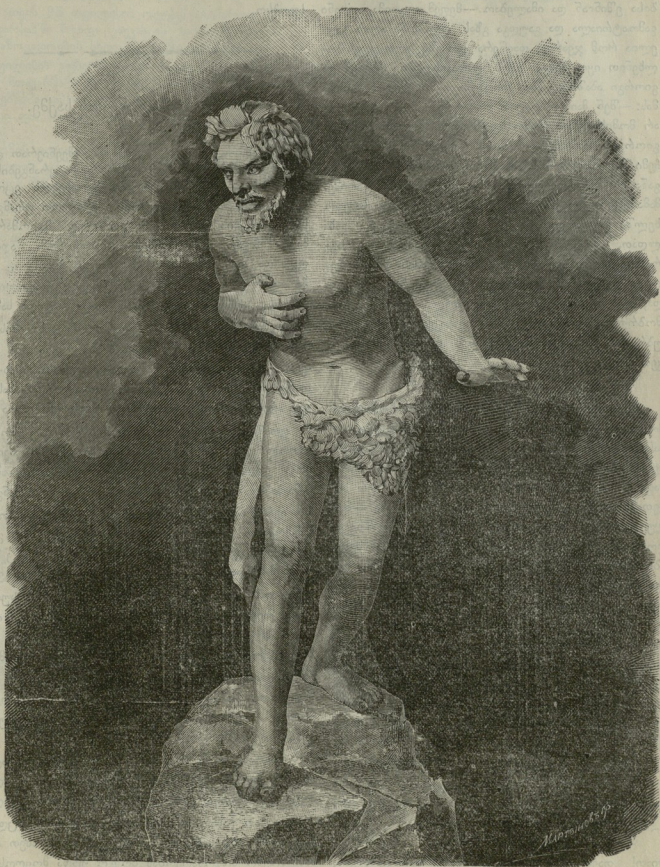
სამოთხიდან განდევნილი ადამი.