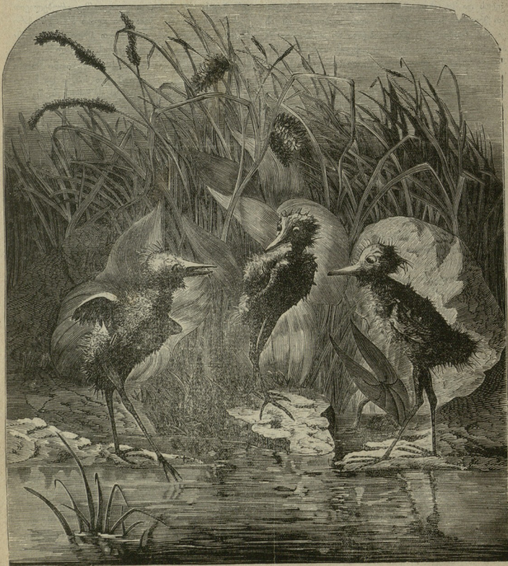
ყანზის (თევზი ყლაპიას) წიწილები.

თეთრან შენობა თუ არა, მისი წარწერა მაინც კი მიიპყრობს თქვენ ყურადღებას. ზედათ ერთ ევებერთელა სახლს, მრავალ სართულებით და დიდი ეზოთი, გსურთ გაიგოთ მისი დანიშნულება, მიდი-