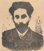
ირაკლიონ ევლოშვილი (1873—1916)

პირობა კი არ დაარღვიეთ, — კიდევ განუმეორათ დედამ და ვასწია ბაზრისკენ.